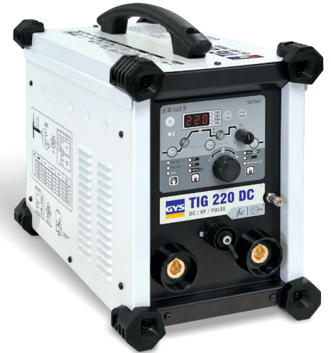
Levereras utan tillbehör