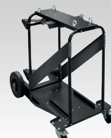
Vagn 10m 3 039711