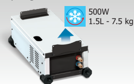
WCU 0,5kW A 039490