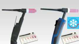
SR26 L 046184